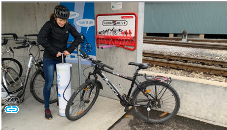
Video Clip - Porträt Velopumpe - Link

Zusätzlich werden einzelne Massnahmen und Projekte des Programms durch das Aktionsprogramm Ernährung, Bewegung und psychische Gesundheit des Kantons Solothurn und der Gesundheitsförderung Schweiz unterstützt. Eine Begleitgruppe wirkt beratend und garantiert eine optimale und breite Abstützung der Projekte. Sie besteht aus VertreterInnen kantonaler Ämter, einer Vertretung der Regionalplanungsgruppe espace Solothurn, der Polizei Kanton Solothurn sowie aus VertreterInnen der ÖV-Unternehmungen, der Tarifverbunde und weiteren Mobilitätsanbietern im Kanton Solothurn.